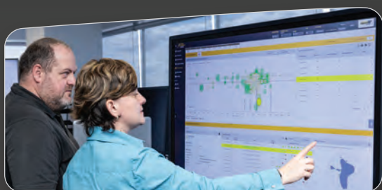
Gerenciamento de Variância de Operadores