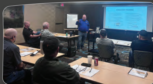
Alcançando a Excelência em Treinamento