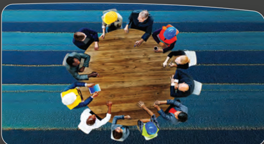
Alinhamento da mina - Eliminação de silos

— Consultor sênior de aprendizagem e desenvolvimento